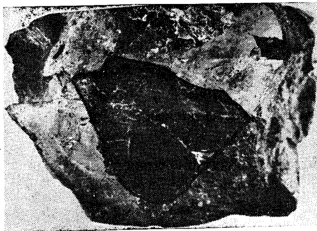
Рис. 3. Доломито-микрокварцитовая брекчия подошвы белкинской свиты (черные — обломки микрокварцита).

массивную, нежели брекчиевую. Только в отдельных штуфах наблюдаются четко оконтуренные обломки. Однако после обжига образцов картина резко меняется, и в них проявляется отчетливая брекчиевая текстура. Это обусловлено тем, что под воздействием высокой температуры углеродистое вещество карбонатов выгорает и они получают светло-серую до белой окраску, на фоне которой рельефно выступают черные обломки микрокварцита (рис. 3). Эти обломки являются самым характерным элементом рассматриваемой брекчии. Подавляющее боль-