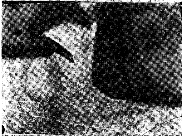
Рис. 2. Микрошлиф зоны резания при высокой скорости резания. V = 55,4 м/мин., S = 0,26 мм/об.; t = 3 мм; \gamma = +10^\circ ; \alpha = +8^\circ

Возможны два способа измерения угла \beta_1 : либо по микрофотографиям, подобным изображенным на рис. 1, 2; либо путем непрерывного наблюдения в процессе резания за боковой поверхностью корня стружки.