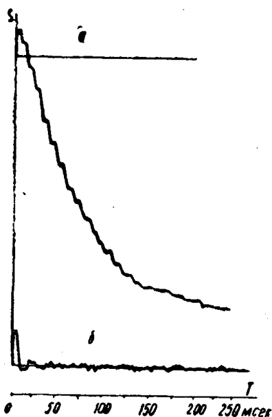
Рис. 3. Перемещение хвостовика става длиной 25,5 м, энергия удара — 6,31 кгм: а) став снабжен коронкой; б) став жестко защемлен

торцевого сечения у коронки. Это объясняется упругой деформацией материала штанг, динамической податливостью упругого става и возможным продольным изгибом [4]. Наибольшее значение перемещения хвостовика соответствует длине става 15,5 м. Результаты проведенных экспериментов представляют определенный интерес при конструировании бурильных машин ударного действия. В качестве примера рассмотрим вопрос о продолжительности перемещения бурильных штанг. В литературных источниках [5] утверждается, что перемещение става прекращается ко времени прихода второго, третьего отраженных ударных импульсов напряжений, и, следовательно, став, как промежуточное звено