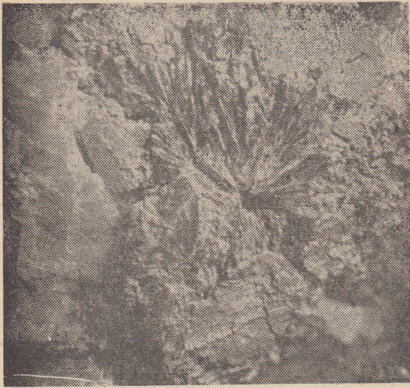
Рис. 2. Шестоватые лучистые кристаллы антимонита. Обнажение 18.

(рис. 3). Исследование таких образцов в отраженном свете показало присутствие здесь мелкой реликтовой вкрапленности антимонита. Антимонит встречен также еще в одном образце в виде мелкого гнезда в 0,5 см, сложенного также агрегатом мелких лучистых кристаллов. Минерал этот довольно хрупкий с чертой темно-красного цвета. В отраженном свете минерал обнаруживает белый цвет и довольно сильный блеск. Достоверность определения минерала проверялась травлением его концентрированной КОН, в результате чего выпал осадок оранжево-желтого цвета.