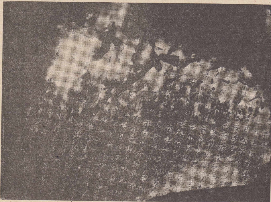
Рис. 3. Шестоватые кристаллы антимонита в кварце. Обнажение 19.