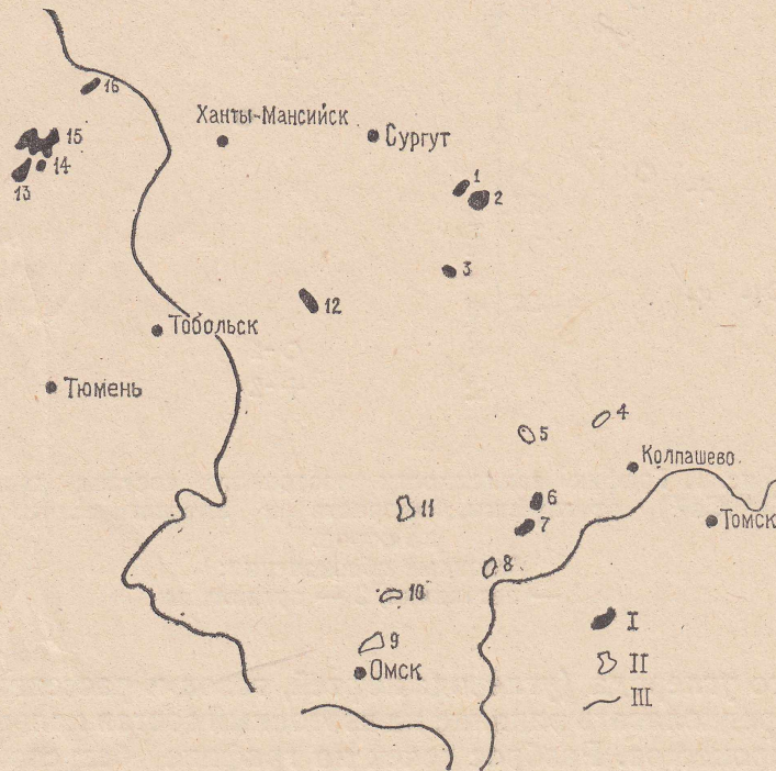
Рис. 3. Схема размещения точек отбора пород на изотопный состав кальция.

Проверка образцов аргиллитов на карбонатность, т. е. на наличие в них углекислого кальция, показала его отсутствие в ряде образцов. Тем не менее, из этих образцов был извлечен и проанализирован «силикатный» кальций. Он имеет повышенное против стандарта содержание \text{Ca}^{48} . В тех же образцах аргиллитов, которые показали наличие угле-