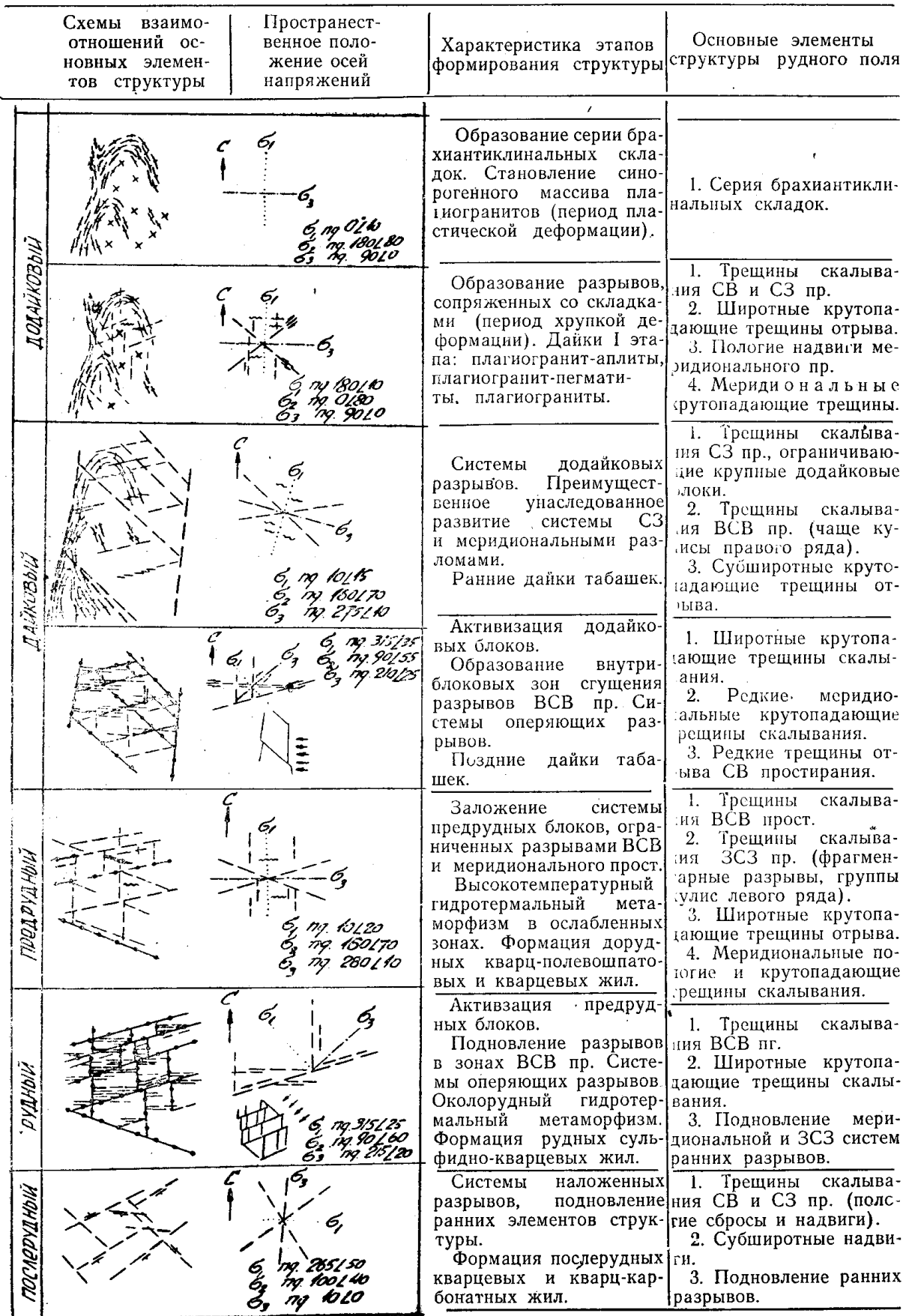
СХЕМА РАЗВИТИЯ СТРУКТУРЫ КОЧКАРСКОГО РУДНОГО ПОЛЯ