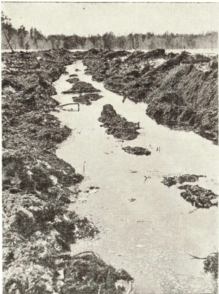
Рис. 6. Вид канавы на болоте через сутки после взрыва.