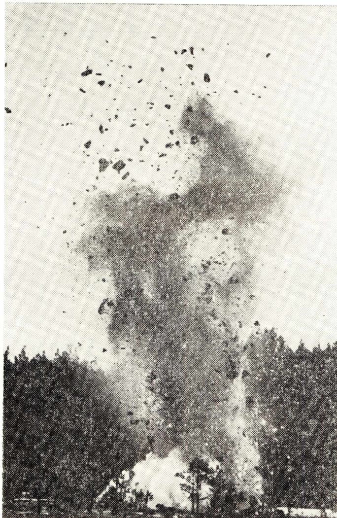
Рис. 5. Взрыв на болоте.

При взрывах торф со льдом поднимало вверх и отбрасывало в стороны, часть взорванного грунта падала на прежнее место (рис. 5). Кро-