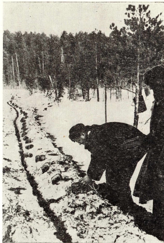
Рис. 7. Подготовка пакетных зарядов взрывчатого вещества.