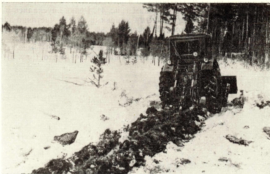
Рис. 3. Землерезная установка БЭТН прорезает щель на болоте.