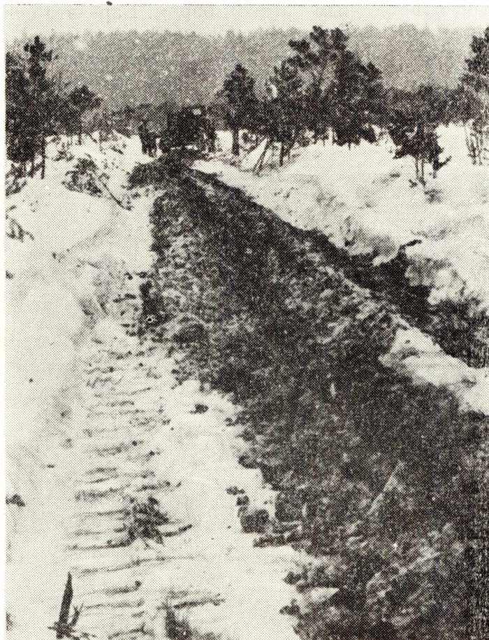
Рис. 2. Щель в торфянике, прорезания установкой «Мороз».

с баром и не увлекалась холостой ветвью снова в щель. Для того чтобы полужидкая масса не сползала в щель после прохождения бара, ее убирали в сторону лопатами. Таким образом, щель получалась чистой (рис. 2). В дальнейшем в машинах для резания болотистых почв следует предусмотреть клиновой или шнековый механизм для удаления вынесенной из щели массы в сторону.