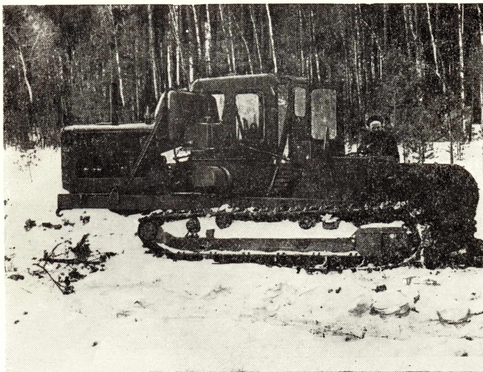
Рис. 1. Общий вид землерезной установки «Мороз» при нарезании щелей на болоте.

За несколько прездгов трелевочный трактор ТДТ-60 с привязанным сзади клином пробил в снеговом покрове болота трассу будущей канавы, сдвинув снег в стороны. Очищенный участок несколько дней промерзал. После этого начали проводить опыты резания мерзлого торфяника землерезной установкой «Мороз» (рис. 1), которая представляла собой гусеничное шасси с установленными на нем двигателем мощностью 54 л. с., коробкой передач, редуктором режущей части врубовой машины типа КМП с исполнительным органом-баром. Бар—это перемещающаяся в направляющей раме бесконечная цепь, состоящая из кулаков и планок. В кулаки вставляются зубки, армированные пластинками твердого сплава. Скорость движения цепи может изменяться в пределах 0,35—5,2 м/сек. Заводка бара в почву и изменение положения его в процессе резания могут осуществляться машинистом с помощью гидравлической системы.