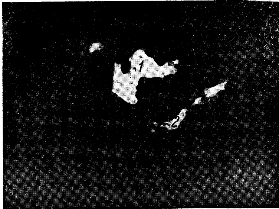
Рис. 2. Золото (1) и галенит (2) в кварце. Аншлиф 3250/5, увел. 500.