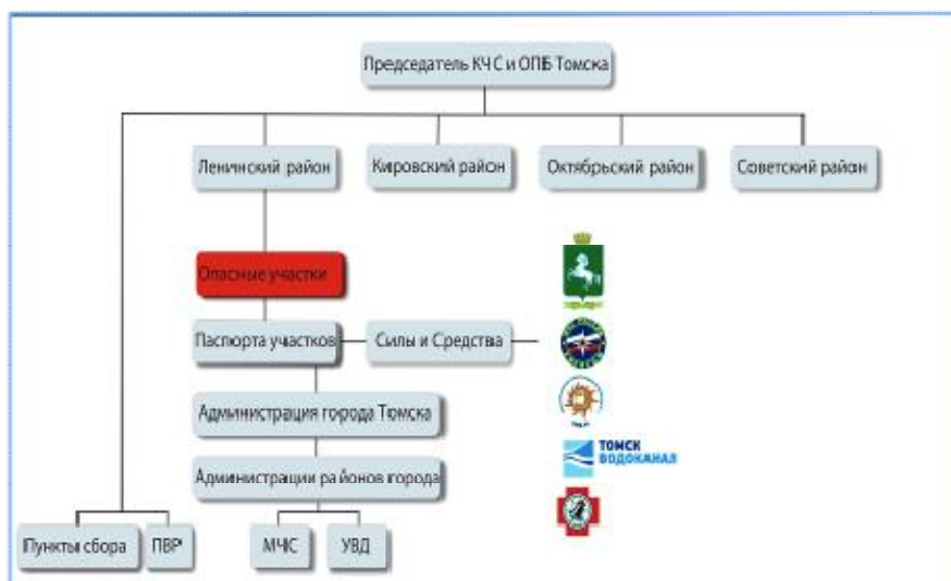
Рис. 2. Схема работы КЧС и ОПБ г. Томска по защите населения и территорий от затопления

Организацией защиты территорий от негативного воздействия паводковых вод руководит Председатель комиссии по чрезвычайным ситуациям и обеспечению пожарной безопасности г. Томска. В состав комиссии входят представители администрации города, главы районов города, сотрудники территориальных органов исполнительной власти (рис. 2) [6, 7].