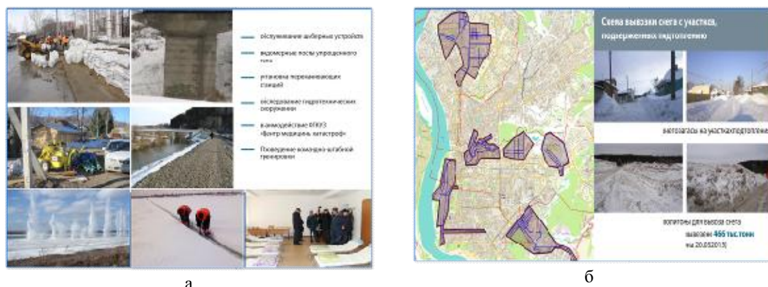
Рис. 3. а) Практические мероприятия по подготовке к паводкоопасному периоду 2015г., б) Организация вывоза снега в 2015г.

Особое внимание в 2015 году Администрацией г. Томска было уделено вывозу снега. Более 450 тыс. т снега было вывезено к началу апреля (рис. 3б).