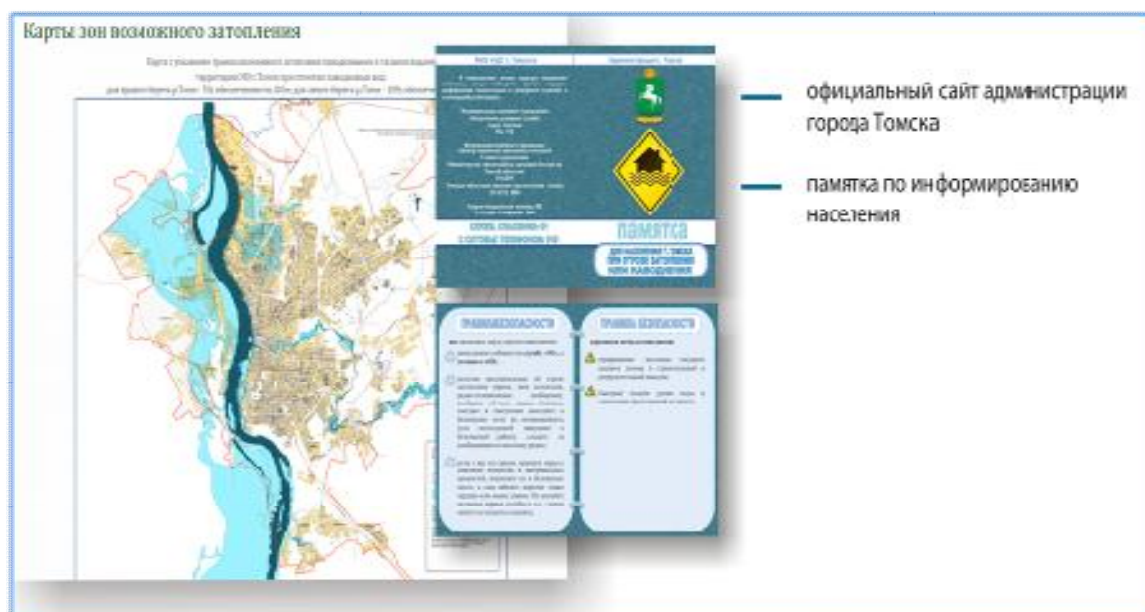
Рис. 4. Организация информирования населения г. Томска в 2015г.

Для информирования населения на официальном сайте Администрации г. Томска размещена вся необходимая информация, подготовлены специальные памятки (рис. 4) [5, 6, 7].