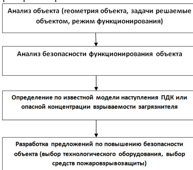
Рис. 3. Алгоритм проведения исследования для некоторого рассматриваемого объекта на базе мобильного модуля

По этапам, представленным ранее, на рисунке 3 приводится алгоритм проведения исследования для некоторого рассматриваемого объекта на базе мобильного модуля.