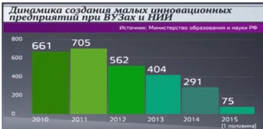
Рис. 1. Динамика создания малых инновационных предприятий при ВУЗах и НИИ

На данный момент (Рис. 2) свыше 50% существующих МИПов при ВУЗах и НИИ развивают свою деятельность в машиностроении, робототехнике, физике и химии. Около 12% внедряют инновации в медицине и биологии. А каждая десятая компания разрабатывает новшества в сфере обслуживания.