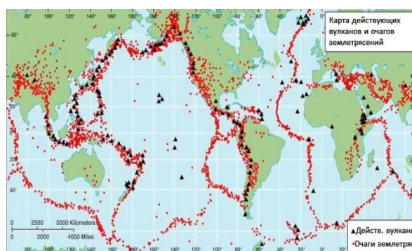
Рисунок 1 –Карта действующих вулканов [3]

Вулканические извержения приводят к возникновению эпидемий и эпизоотий, росту числа заболеваний и нарушению воспроизводства населения, сокращению пищевой базы, неблагоприятным изменениям ландшафтных условий, ухудшению качества атмосферного воздуха по причине поднятия пылевых туч и распространения аэрозольных частиц. Основную опасность для здоровья человека представляют выбрасываемые при извержении пепел и газы.