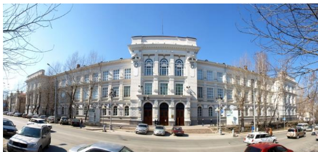
Национальный исследовательский Томский политехнический университет (главный корпус)