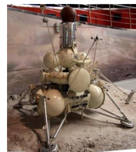
Луноход «ЛУНА-24» с турбобуром и заборным устройством для отбора лунного грунта