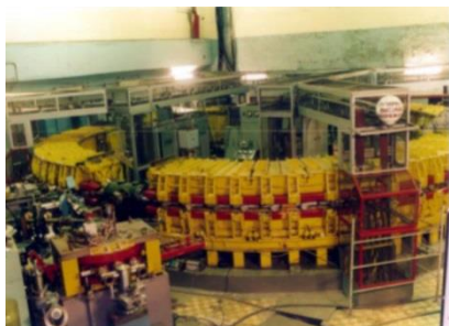
Крупнейший электронный синхротрон, созданный в ТПУ

В ТПУ создан научно-образовательный центр для подготовки элитных специалистов для научно-исследовательской и инновационной деятельности в таких областях, как радиационные технологии, обращение с отработанным ядерным топливом, проектирование,