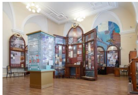
Музей истории ТПУ

Чтобы нам, действительно, стать центром превосходства, мы должны предложить миру не пять-шесть интересных разработок, а трансформироваться в мощный «мозговой» центр, где помимо фундаментальных и прикладных исследований по «ресурсоэффективной» тематике велась бы работа по широкой популяризации этой темы, регулярно проводились бы форумы и конференции с привлечением лучших ученых и экспертов России и мира. Было бы интересно создать при ТПУ Центр изобретательства, который взял бы на себя функции привлечения и стимулирования изобретателей со всей Сибири, продвижения и коммерциализации их идей и разработок.