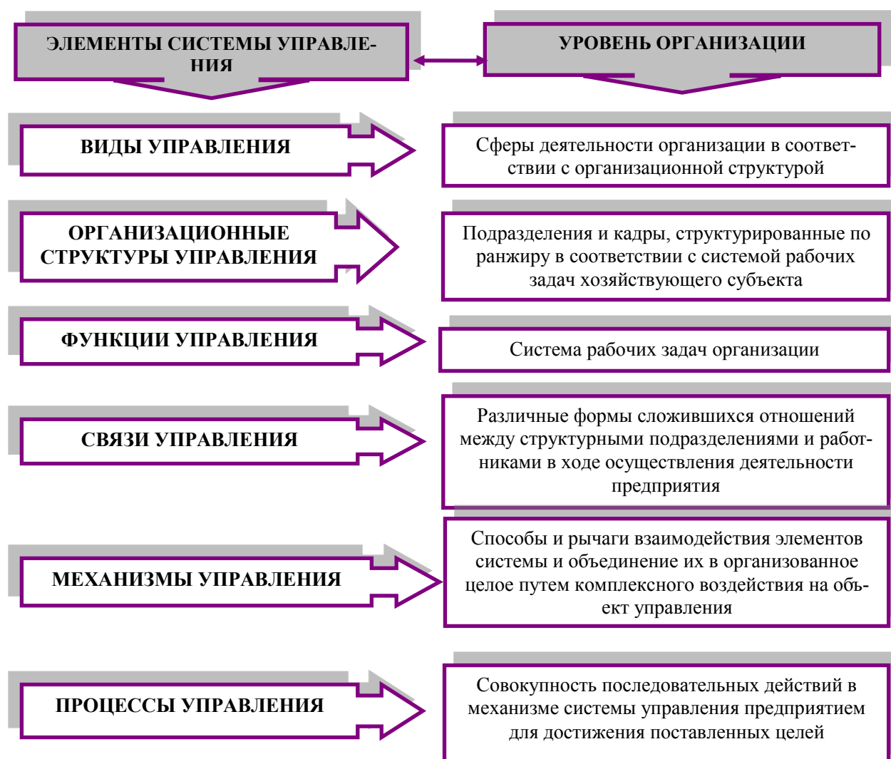
Рис. 2. Элементы системы управления в уровнях организации

В заключение еще раз подчеркнем, что современный менеджмент, отвечающий всем требованиям экономики знаний, обладающий свойствами системы, имеет целый комплекс сложных подсистем управления, свои входы и выходы в виде ресурсного обеспечения и обратной связи, которые составляют элементную базу современного менеджмента (рис. 2).