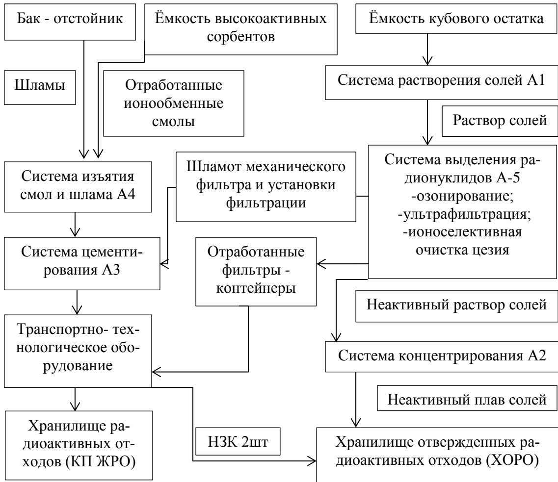
Рис. 1. Принципиальная схема переработки ЖРО на КАЭС

На рисунке 2 представлен график, который показывает динамику накопления ЖРО на Кольской атомной станции.