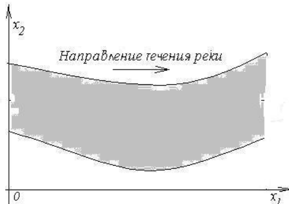
Рис. 1. Схема расчетной области

Рассмотрим плоскую задачу конвективного тепло- и массопереноса загрязняющих веществ в водоеме. Источник загрязнения моделируется поверхностным источником массы нагретых веществ, выделяющихся в результате залпового выброса в течение некоторого времени. Считается, что течение направлено слева направо и носит развитый турбулентный характер, а для описания конвективного переноса под воздействием течения реки используются двумерные уравнения Рейнольдса для турбулентного течения. Начало координат x_1 = 0 , x_2 = 0 расположено в левой части рассматриваемой области, оси Ox_1 и Ox_2 расположены в плоскости земной поверхности (рис. 1).