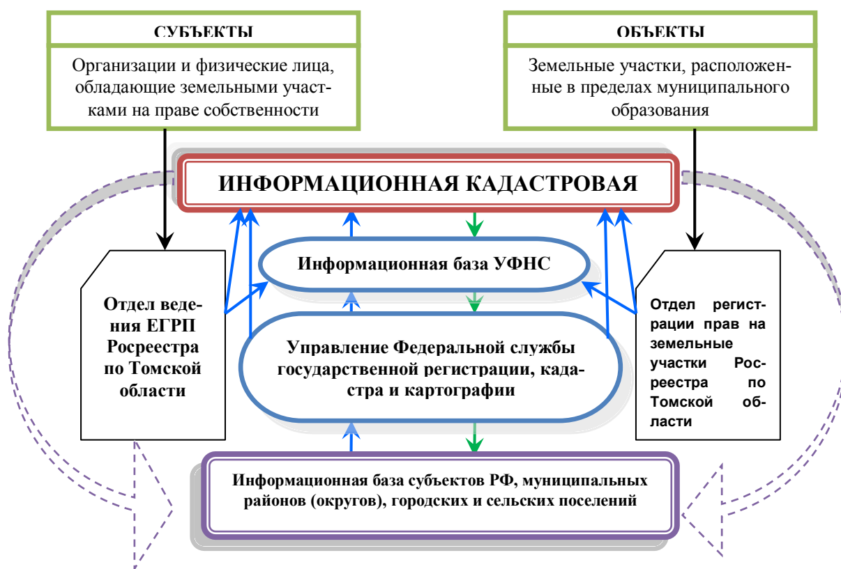
Рис. 1. Схема взаимодействия информационной кадастровой системы, органов государственной власти, объектов и субъектов земельных правоотношений

Схема взаимодействия информационной кадастровой системы, органов государственной власти, объектов и субъектов земельных правоотношений представлена на рис. 1.