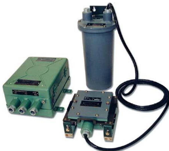
Рис. 1. Сигнализатор прохождения внутритрубных объектов СПРА-4