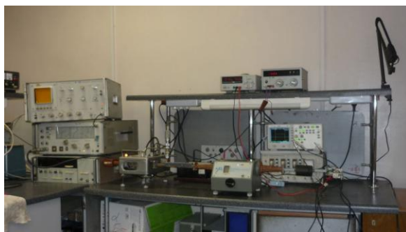
Рис. 2. Экспериментальная установка

В проекте создается принципиально новое приемно-передающее устройство [18–20]. Исследованы принципы построения антенн, генераторов видеоимпульсов, апробированы схемы приема и обработки сигналов. Разработаны и реализованы варианты логарифмических усилителей, устройств цифровой обработки. Имеется большой теоретический и практический научный задел по сверхширокополосным системам исследования электродинамических характеристик природных и техногенных сред в широком частотном диапазоне электромагнитных излучений. Проведены предварительные исследования СВЧ-передатчика большой мощности на диоде Ганна. Достигнуты следующие технические характеристики передатчика: рабочая частота – 9,3...9,5 ГГц; выходная импульсная мощность – не менее 15 Вт; длительность импульсов запуска – 1000 нс; ток диода Ганна – 0,9...1,2 А; время установления и спада СВЧ-импульса – 6 нс; амплитуда импульса запуска – 5 В; напряжение источника питания – 60 В; потребляемый ток – 30 мА. Передатчик был разработан и используется в системах ближней радиолокации, но его технические характеристики позволяют использовать передатчик в системах MWD.