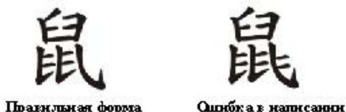
Рис. 3. Ошибка в написании иероглифа 鼠 shǔ («мышь»)

Этот подход является особенно эффективным, поскольку помогает студентам запоминать точное написание иероглифа. Если обратить внимание на три вертикальные черты с крюком внизу иероглифа 鼠 shǔ , можно отметить, что только возле двух из них присутствует по две горизонтальные точки. Однако при написании этого иероглифа многие студенты допускают типичную ошибку, дописывая две горизонтальные точки и возле третьей черты с крюком. Данная ошибка проиллюстрирована на рис. 3.