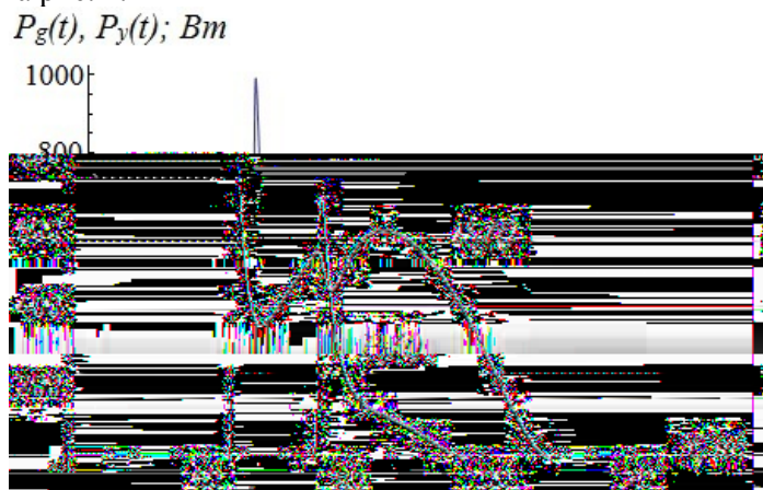
Рис. 3. Диаграммы мощности излучения P_g на длине волны 510,6 нм и P_y на длине волны 578,2 нм в момент времени t от начала накачки

Первоначальный рост сопротивления плазмы обусловлен увеличением температуры электронов при еще низкой концентрации электронов в активной среде. Благодаря высокой температуре электронов в активной среде активно протекают реакции ионизации, и со временем концентрация электронов повышается, что приводит к понижению сопротивления плазмы. При достаточно большой концентрации электронов происходит пробой активной среды согласно диаграммам на рис. 2.