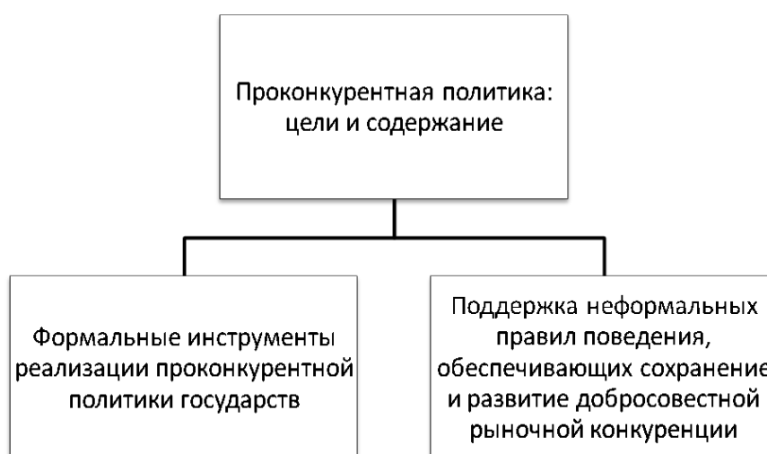
Рис. 3. Структура проконкурентной политики государств

В концепции проконкурентной политики признается объективная возможность достижения временного монопольного положения на основе конкурентного преимущества в технологии как существенного условия эффективности деятельности. Как правило, эта технология является результатом приложения когнитивного капитала. Признание такой возможности отличает проконкурентную политику от «антимонопольной политики», использующей структурный подход к регулированию конкуренции (определение предела доли рынка).