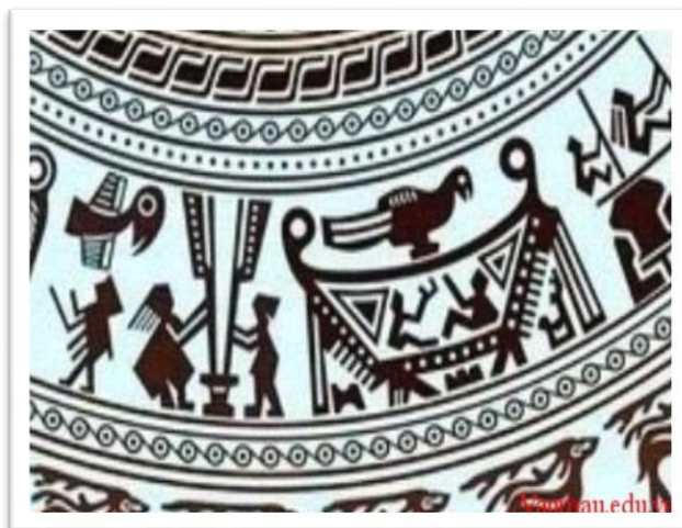
Рис. 2. Элемент росписи донгшонского барабана