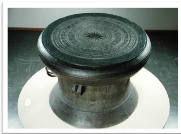
Рис. 1. Донгшонские барабаны

В отношении с природой и обществом, в производственной деятельности осознание вьетнамских жителей достигло уровня абстрактного мышления. Они сделали орудия производства и оружие из камня и металла. Донгшонская культура сохранилась до настоящего времени в таких элементах, как донгшонские барабаны и керамика. Через барабаны вьетнамцы пришли к геометрическим вычислениям: они стали делить круг на шесть равных частей и таким образом пришли к пониманию отношения между радиусом и окружностью. Так были заложены основы геометрии и точных вычислений. Изображения на барабанах связаны со многими легендами, в которых описывалась деятельность народа.