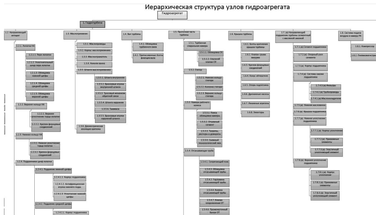
Рис. 1. Фрагмент разработанной иерархической структуры гидроагрегата

В этих целях для каждого объекта разрабатывается подробная иерархическая структура элементов, которая служит основой для построения информационной модели оборудования. Она, в свою очередь, включает в себя как математическую модель гидроагрегата и его элементов, отражающую функциональные взаимосвязи и влияние различных факторов на надежность узлов, необходимую для диагностики и прогнозирования износа оборудования, так и компьютерную 3D-модель агрегата, дающую пользователю ИАС наглядное представление об оцениваемом оборудовании.