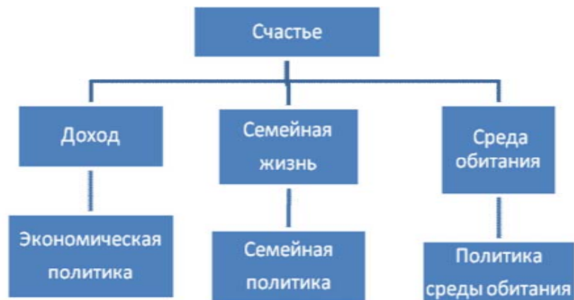
Рис. 1. Экономическая политика в идеальном мире (по R. Layard)

Традиционный подход к достижению счастья с помощью экономической политики может быть показан на рис. 1.