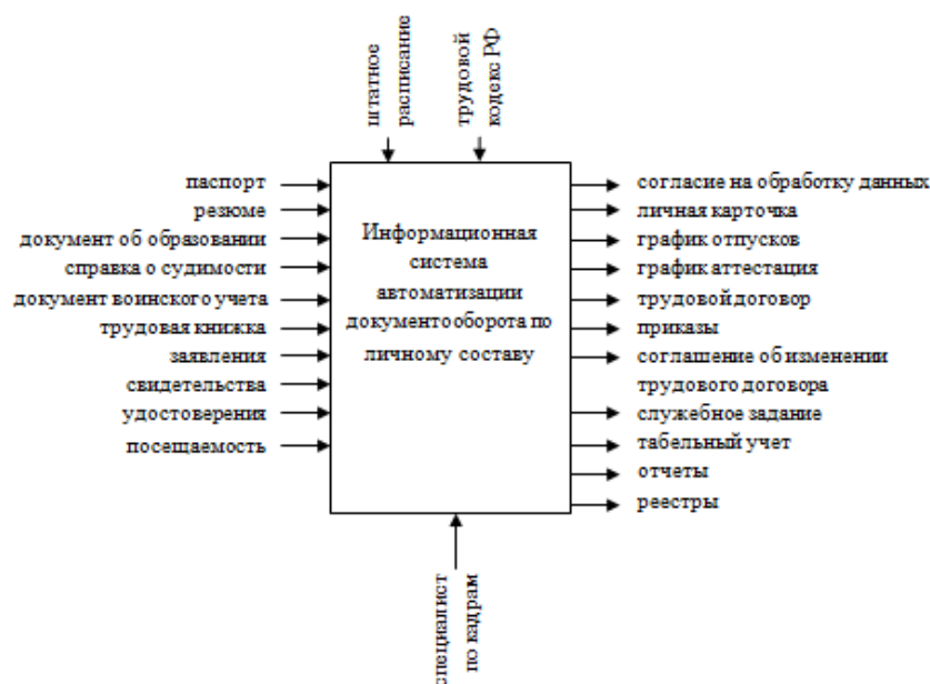
Рис. 1. Диаграмма А0 «Информационная система автоматизации документооборота по личному составу»

На основании этой информации была спроектирована информационно – логическая модель. На рисунке 1 представлен уровень А0 данной модели. В докладе будет представлена детализация этой модели, а также интерфейс разработанной информационной системы.