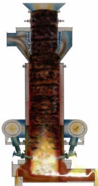
Рис. 2. Разрез промышленной шахтной печи ОХУ Сир

Печь ОХУ Сир является своего рода миниатюрой доменной печи как по исполнению, так и по технологическому процессу. В верхней части печи (колошник) располагается загрузочный бункер, ниже находится камера газоотвода. При такой конструкции исключается задымление колошника печи во время работы. Средняя часть печи (шахта) служит для предварительного нагрева шихтовых материалов и завершается зоной расплавления металла и шлака. В нижней части (горн) размещаются металлоприемник и устройство для разделения металла и шлака. В отличие от обычной доменной печи, в печи ОХУ Сир металл и шлак выдаются непрерывно в чугуновозные ковши или миксеры (рис. 2).