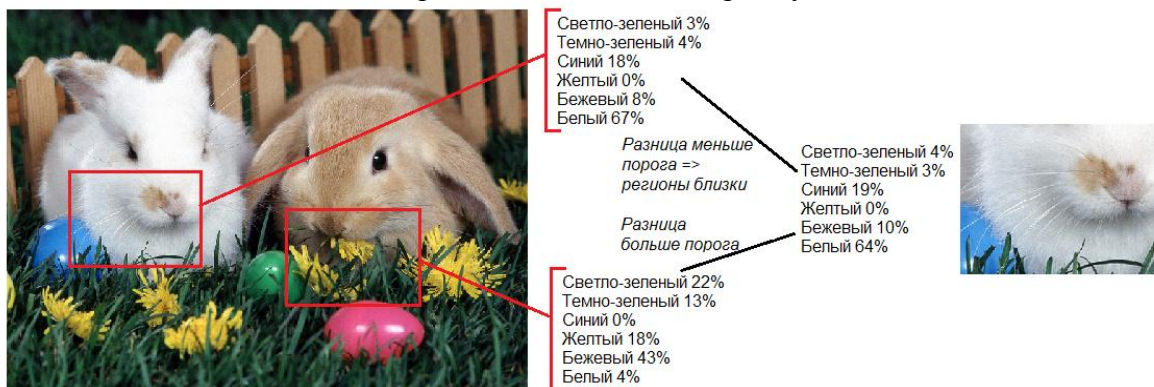
Рис.2. Анализ гистограмм

Затем в цикле по исходному изображению пиксель за пикселем проходит окно, размером искомого изображения. В этом цикле для каждого такого окна ищется процентное соотношение каждого цвета и сравнивается с эти же показателем второго изображения, как показано на рисунке 2. Если показатели обоих изображений полностью совпадают, окно в исходном изображении выделяется прямоугольником.