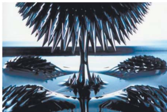
Рис. 1. Поведение магнитной жидкости в магнитном поле [1]

Таким образом, МЖ – это перспективный материал, обладающий интересными реологическими и магнитными свойствами, который в недалёком будущем, по нашему мнению, будет широко использоваться в промышленности, особенно в машиностроении. МЖ объединяют все достоинства жидкостей (небольшой коэффициент трения, высокая проницаемость, способность к смачиванию) и магнитных твёрдых тел (способность удерживаться в определённом месте под действием магнитного поля). Проблема получения МЖ и их использования заслуживает дальнейшего рассмотрения и активного изучения.