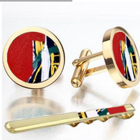
Рис.5 Запонки и зажим, с использованием фрагмента картины Жана-Мишеля Баския в оформлении

Данные изображения привлекают цветовым решением. Художники используют достаточно смелые цвета, но в то же время спокойные. Такие цветовые гаммы очень хорошо сочетаются с золотом.