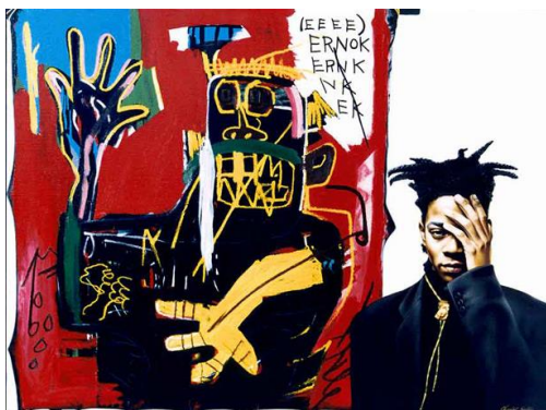
Рис.3 Жан-Мишель Баския