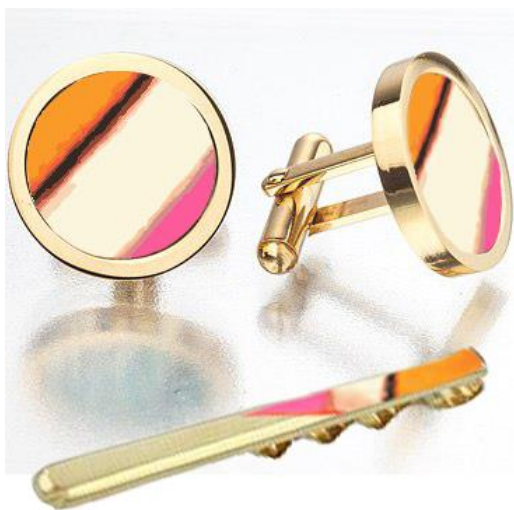
Рис.4 Запонки и зажим, с использованием фрагмента картины Марка Ротко в оформлении

Данные изображения привлекают цветовым решением. Художники используют достаточно смелые цвета, но в то же время спокойные. Такие цветовые гаммы очень хорошо сочетаются с золотом.