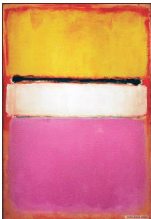
Рис. 2. Марк Ротко «Белый центр» 1950г.

Изображения необходимо предварительно стилизовать, для упрощения формы и цветопередачи.