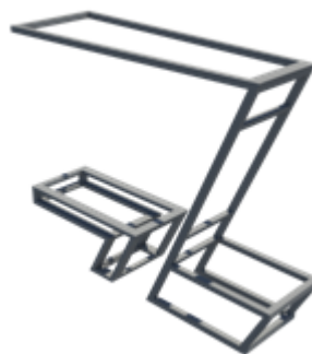
Рис. 1. Каркас для скамейки

При необходимости получения 220 вольт энергия из контроллера проходит через инвертор (рис. 2). Также будет установлен датчик для контроля, для автоматического включения и выключения освещения во время присутствия и отсутствия человека, это даст возможность экономить электроэнергию.