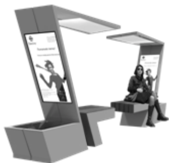
Рис. 5. Расстановка двух скамеек

Модульность скамейки дает возможность соединить скамейки (две или больше) в разные композиционные группы (рис. 5, рис. 6).