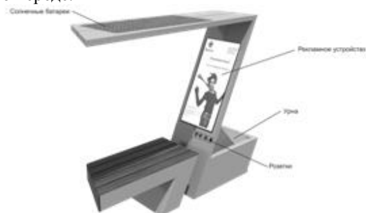
Рис. 4. Модель скамейки

Обдумав и решив, где будет располагаться устройства в трехмерной графике уже создавалась полная модель. Объемное моделирование дает полное представление о форме проектируемого объекта, а также имеет возможность передать фактуру выбранных материалов с учетом нужного цвета. С помощью трехмерной графики можно расположить модель в любом месте города, чтобы рассмотреть, как будет выглядеть объект в городской среде.