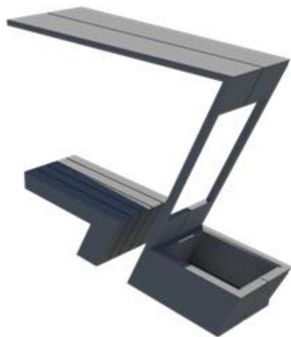
Рис. 3. Разработка модели ПО Autodesk 3D Max Design

На скамейке имеется место для урны (рис. 3). Так же при необходимости можно воспользоваться этой территорией для посадки растений.