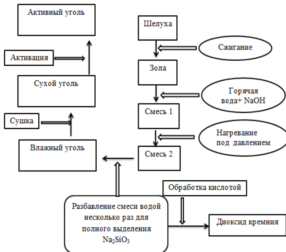
Рис. 1. Технологическая схема процесса переработки рисовой шелухи с получением активного угля и диоксида кремния