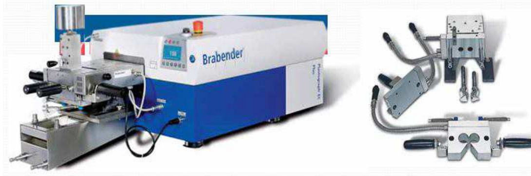
Рис. 1. Общий вид смесителя фирмы Brabender.

Подготовка полимерных смесей производилась с помощью лабораторного смесителя фирмы Brabender (рис. 1). Смеситель предварительно нагревался до 170°C и в рабочую камеру помещается полимер. После образования расплава полимера под действием температуры и за счет возникающих сдвиговых деформаций в него постепенно доавлялся наполнитель до необходимой концентрации. Содержание наполнителя С в ТПМ изменялось от 5 до 30 об.%.