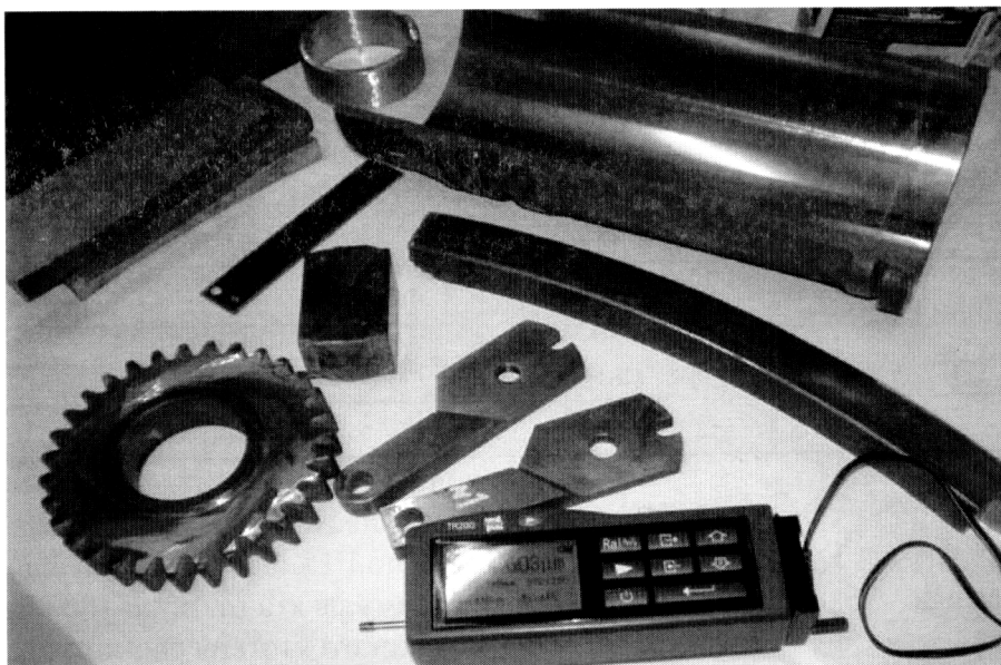
Рис. 2. Экзаменационные образцы и измеритель шероховатости TR200

Измерения шероховатости поверхности осуществлялись профилографическим методом с помощью портативного измерителя шероховатости TR200. Экзаменационные образцы и измеритель шероховатости TR200 изображены на рис. 2.