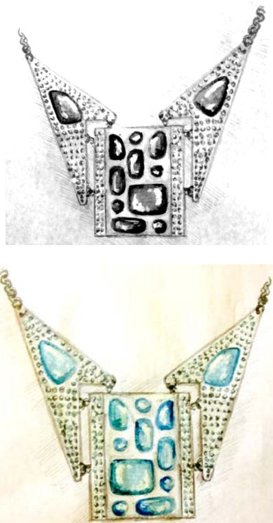
Рис. 3 Авторские украшения

В украшениях в стиле арт – деко форму камням можно придать абсолютно любую: бочонка, квадрата, трапеции, кабошона, багета, причём иногда они встречались в одном изделии (рис. 3). Украшение выполнено из белого золота или серебра, вставки – мелкие бриллианты и сапфиры или топазы.