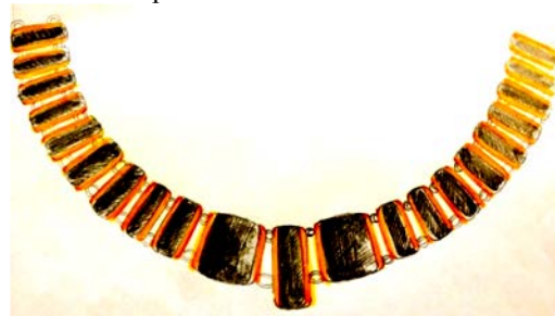
Рис. 2 Авторское украшение

На рисунке 1 представлено ювелирное изделие в стиле арт – деко. Строгие геометрические элементы украшения могут быть отделаны яркой эмалью или лаком, что создаст необычайные цветовые эффекты. Также основу можно изготовить из дерева. А сочетание различных материалов дает возможность использовать драгоценные, полудрагоценные и поделочные камни. К примеру, известный ювелир Жорж Фуке объединял в одном изделии эмаль и бриллианты, топазы и аквамарины.