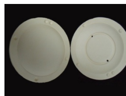
Рис.3. Пример готовой гипсовой формы

Для литья применяется шликер – жидкой массы, водной суспензии на основе глины. Работа начинается с изготовления гипсовой формы, но иногда можно пропустить этот этап, так как в продаже доступны уже готовые гипсовые формы (рис.3).