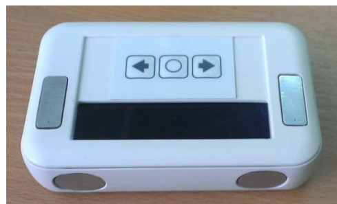
Рисунок 1. Расположение электродов в корпусе.

вышеприведенных требований в них реализована упрощенная процедура регистрации ЭКГ первого стандартного отведения с пальцев и последующей обработкой сигнала в приборе и на ПК.