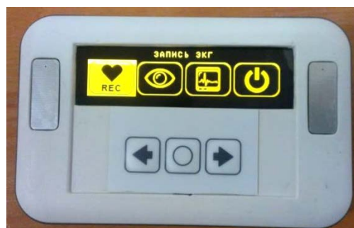
Рисунок 2. Карманный электрокардиограф.

На данный момент коллективом кафедры ИИТ реализуется проект по созданию карманного электрокардиографа с автономным питанием, OLED экраном и управляющим элементом в виде 3-х кнопочной клавиатуры (рисунок 2).