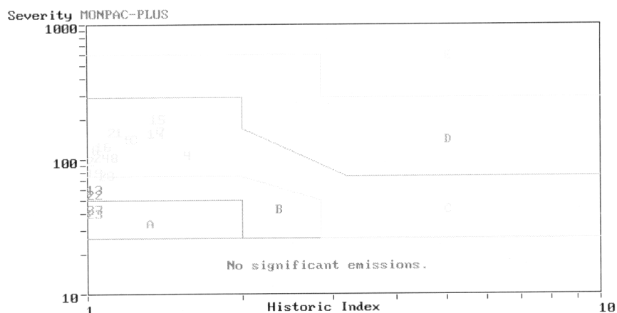
Рис. 2. Классификация источников акустической эмиссии по «Монрас»

В связи с регулярным техническим освидетельствованием резервуарного парка «ТомскНефтехима» перед Томским Центром Технической Диагностики «Химотест» возникла необходимость в составлении технологических карт контроля. Передо мной была поставлена задача нахождения источников информации и проведение анализа существующей нормативной документации с целью разработки технологических карт контроля качества конкретных шаровых резервуаров для хранения сжиженных газов на заводе ПС и ГП.