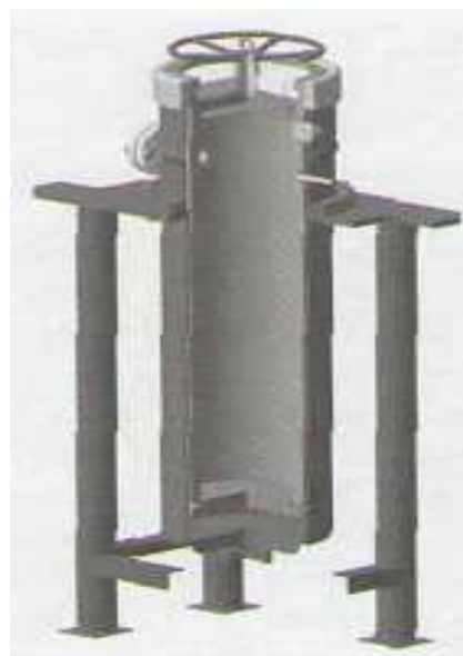
Рис. 1. Схема промышленного СВС реактора [5]

Уникальность нового производства заключается в том, что применяется многотоннажное производство, основанное на принципах метода самораспространяющегося высокотемпературного синтеза. В сочетании с такими преимуществами СВС-технологии как отсутствие потребления электроэнергии, быстротечность процесса в экстремальных условиях повышенного давле-