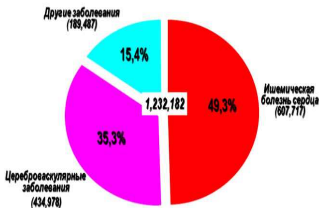
Рис. 1. Отчет ВОЗ по ССЗ за 2012 г.

Решением данной проблемы занимается множество предприятий, но особого успеха добились лишь единицы.