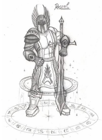
Fig. 1. C'est «tank»...