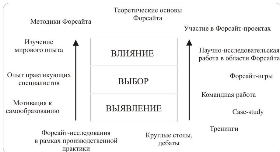
Рис. 2. Модель Форсайт – обучения.

Модуль «Влияние». На базе информации, полученной при освоении двух предыдущих модулей, появляется возможность научиться формировать идеальное желаемое будущее технической системы, принимая правильные управленческие решения и выбирая оптимальные направления их развития в настоящем. Таким образом, в процессе осуществления своей профессиональной деятельности инженер сможет влиять на будущее [5].