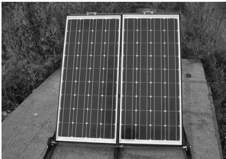
Рис. 2. Солнечные панели на опорной раме

Для выбора электропривода поворотного механизма произведён расчёт максимального момента вращения используемой солнечной батареи. Получено, что выходной вал электропривода должен выдерживать максимальный момент вращения не менее 14,56 Н·м [3].