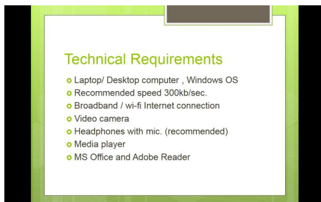
Рис. 1. Минимальные технические требования для проведения дистанционных занятий.

Во-вторых, для многих студентов интернет-обучение является поначалу некомфортным и даже пугающим, кто-то не готов отойти от традиционной модели обучения в аудитории, а кто-то не уверен в своих навыках использования компьютерных приложений, необходимых для ДО процесса (как правило, это относится к студентам старшего возраста). В этом случае, задача преподавателя – максимально аккуратно познакомить студента со всеми особенностями такого обучения, провести пробное занятие. Перед занятием полезно отправить студенту список технических требований, необходимых для бесперебойного проведения дистанционных занятий (рис. 1).