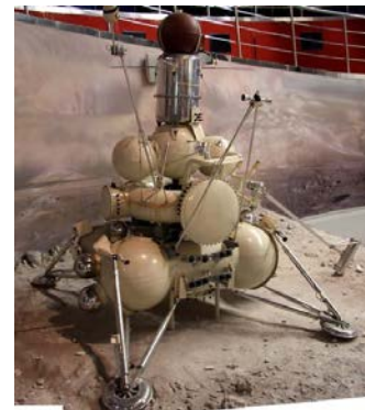
Автоматическая лунная станция «Луна-24» с турбобуром и заборным устройством для отбора лунного грунта, разработанные в ТПУ