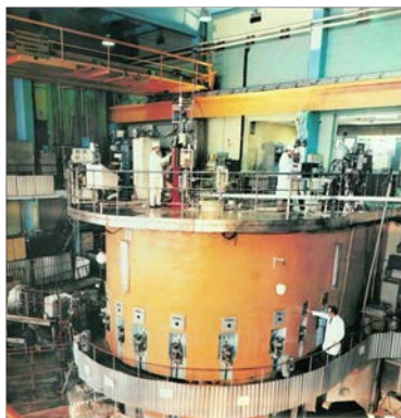
Исследовательский ядерный реактор ТПУ

Разработаны новые сенсоры и датчики для автономного обитаемого подводного аппарата (АНПА) на основе современных композитных, полимерных и керамических материалов; создана модель группового управления, которая учитывает как периоды автономного плавания АНПА, так и выходы на сеансы связи; разработан макет аппаратно-программного комплекса для передачи данных по гетерогенным каналам связи; проведены испытания гидроакустического модема, обеспечивающего скорость передачи данных 1,2 кб/с при полосе частот 2 кГц; опубликовано 30 статей в журналах, индексируемых в базах данных Web of Science и Scopus, в том числе 3 - в журналах с импакт-фактором > 1.