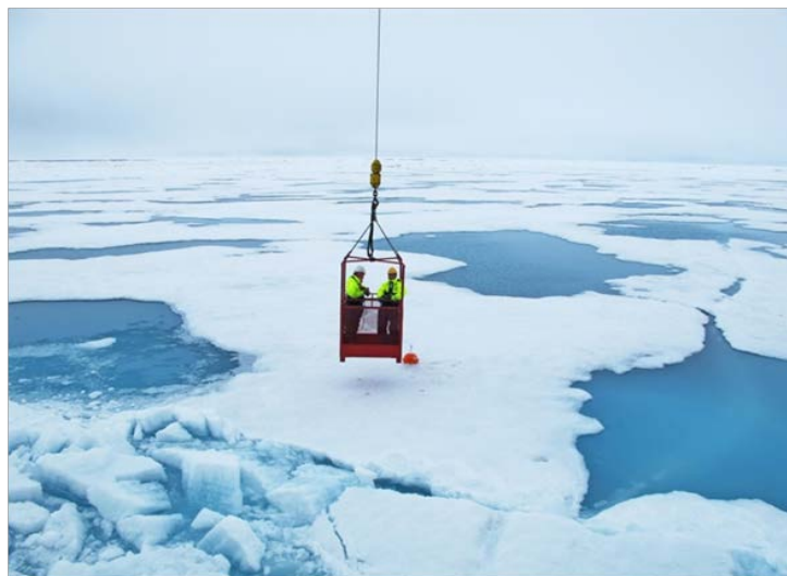
Научные исследования ТПУ в Арктике

Стажировку прошли на промышленных предприятиях 111 НПП ТПУ. Это в Siemens AG, TSI Instruments Ltd., ОАО «Газпром», Госкорпорации «Росатом», Госкорпорации «Роснано», ОАО «Информационные спутниковые системы» имени академика М.Ф. Решетнёва и др.