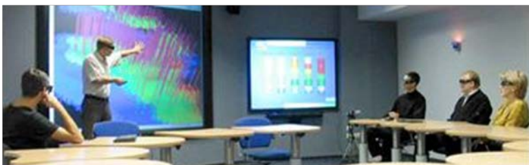
Зал 3D визуализации в Международном Инновационно – научно - образовательном центре профессиональной переподготовки специалистов нефтегазового дела ИПР ТПУ – совместный проект Heriott-Watt с Эдинбургским университетом (Великобритания). Защита магистерских диссертаций

Электронное обучение для очников: Организация управляемой самостоятельной работы студентов с использованием электронных курсов Moodle (13 тыс. пользователей). Разработка и введение в учебный процесс 195 новых электронных курсов. Эксперимент по использованию MOOC's – более 70 сертификатов Coursera.