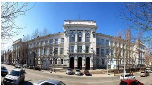
Национальный исследовательский Томский политехнический университет

В 2014 году в университете реализовывались: