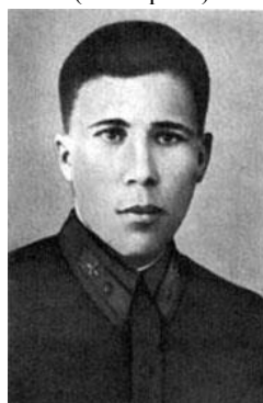
Фото 4. Черных Иван Сергеевич

Иван Черных навечно был зачислен в списки гвардейского Севастопольского Краснознаменного полка Ракетных войск стратегического назначения за свой подвиг, совершенный 16 декабря 1941 года. Во время атаки колонны вражеской техники возле города Чудово самолет был подбит вражеской артиллерией. Будучи командиром экипажа Иван Черных, после безуспешных попыток сбить пламя, принял решение идти на таран вражеской колонны. За наземный таран, который также был назван «огненным» Иван Черных был удостоен звания Героя Советского Союза (посмертно).