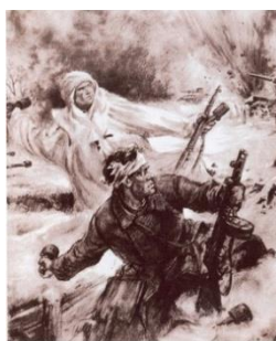
Фото 11. Сражение под Москвой

Велика Россия, а отступать некуда – позади Москва!