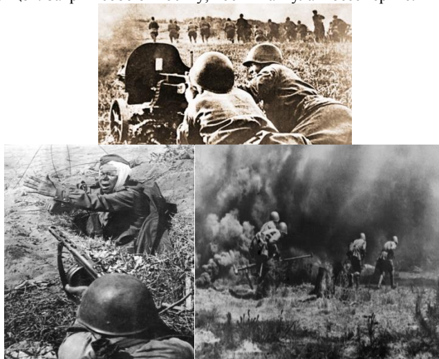
Фото 2. Защита Москвы

В течение 75 дней непрерывные, жестокие бои вела 166-я дивизия на Смоленщине, потом было отступление, окружение, попытки прорыва к своим... Из окружения 14 ноября 1941 г. вышло только 517 человек. Но 166-я стрелковая дивизия выполнила свой долг и сохранила свою честь ценою беспримерного мужества и героизма, ценою жизни многих своих бойцов. Закрыв собою Москву, 166-я шагнула в бессмертие.