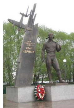
Фото 5. Памятник И. С. Черных в г. Томске