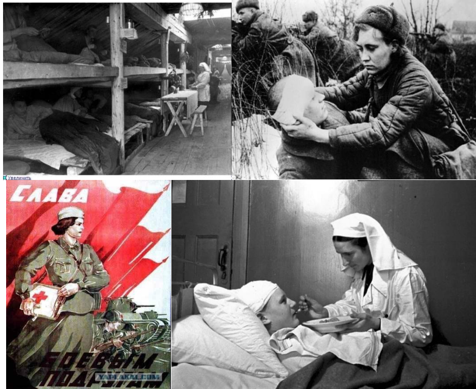
Фото 20. Работа в медсанбатах и госпиталях

размещены в лучших помещениях города, госпиталям были отданы учебные корпуса и общежития институтов, Дом науки, гостиница, школы № 3, 8, 14 и 43 и др. Город обеспечил госпитали необходимым оборудованием и лечебными средствами, топливом и продуктами, укомплектовал медицинским и хозяйственным персоналом. В госпиталях работали крупные ученые, преподаватели и опытные врачи медицинского института.