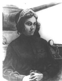
Фото 12. Октябрьская Мария Васильевна – Герой Советского Союза