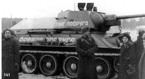
Фото 13. Танк «Боевая подруга», водитель которого М. В. Октябрьская