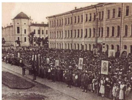
Фото 1. Митинг на площади Революции в г. Томске 22 июня 1941 г.

Когда вражеские орды сделали первые шаги по нашей земле, в далекой Сибири раннее солнце не предвещало приближающейся трагедии. В то воскресное утро 22 июня 1941 года в г. Томске стояла тёплая погода. Многие томичи отдыхали на природе. Студенты сдавали последние экзамены. Вдруг в 12 часов дня по московскому времени радио внезапно замолчало. И через несколько минут взволнованные томичи услышали: «Граждане и гражданки Советского Союза! Сегодня, в 4 часа утра, без объявления войны германские войска напали на нашу страну».