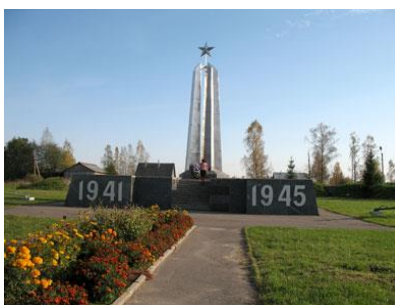
Фото 18. Мемориал Героям-политехникам г. Томска, погибшим в сражении под Смоленском (с. Верховье)