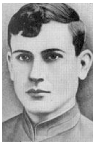
Фото 6. Иван Туркенич – Герой Советского Союза

Иван Туркенич – юноша с твердым и волевым характером, обладал актерскими данными: владел различными музыкальными инструментами, хорошо пел, танцевал. Перед войной закончил офицерские курсы, воевал, раненый вернулся в Краснодар, став командиром организации.