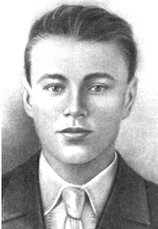
Фото 5. Иван Земнухов – Герой Советского Союза

Ваня Земнухов – юноша с открытой и глубоко поэтической натурой, с удивительным сочетанием доброты и душевной твердости, тонкой впечатлительности и мужества. Он отличался поразительным оптимизмом, жаждой знаний, мечтал о высокой и светлой дружбе.