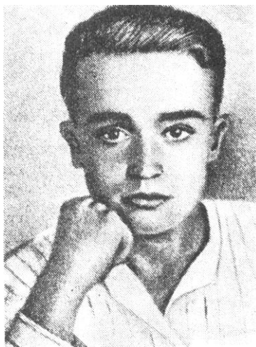
Фото 1. Олег Кошевой – Герой Советского Союза

Олег Кошевой – высокий, спортивно сложенный, не по годам физически сильный, волевой, серьезный юноша, любил стихи и сам писал их, любил музыку, поэзию, его большие карие глаза жадно и открыто смотрели на мир, он отлично учился, был всегда выдержанным, пользовался большим уважением сверстников. Выросший без отца очень любил мать и бабушку, воспитавших его.