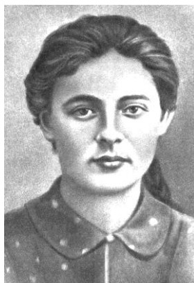
Фото 2. Ульяна Громова – Герой Советского Союза

Сергей Тюленин – отчаянной смелости парень. Он всё умел и ничего не боялся. Живой, полный жизненной энергии и страстного желания подвига, он начал первым активно действовать против немцев, по его предложению организация была названа «Молодой Гвардией». Его живые серые, часто смеющиеся, озорные глаза становились суровыми и стальными, когда он сталкивался с врагом. Мальчишки в округе боготворили его и гурьбой ходили за ним. Сережа прекрасно рисовал, его рисунки хранятся в музее по сей день. Самые опасные и трудные поручения организации выполнял Сергей со своей группой.