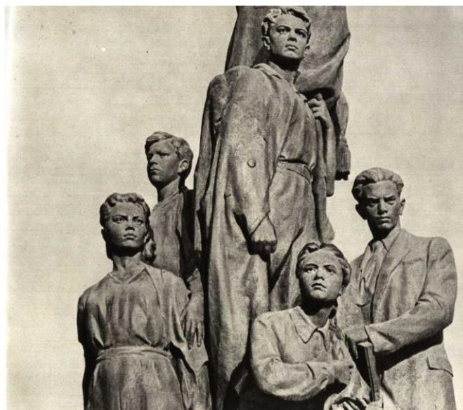
Фото 7. Памятник молодогвардейцам – Героям Советского Союза: Олегу Кошевому, Ульяне Громовой, Ивану Земнухову, Любови Шевцовой, Сергею Тюленину в г. Краснодоне.