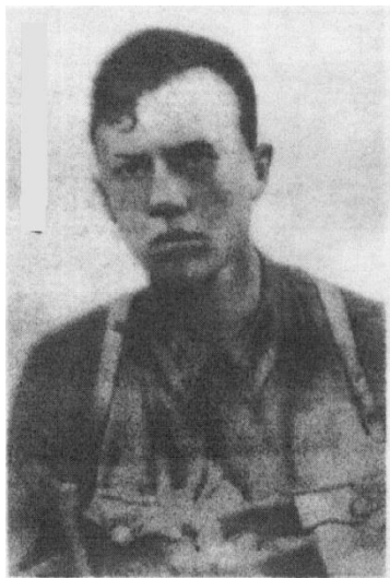
Фото 1. Очкин Алексей Яковлевич во время боев в Сталинграде

К наиболее ярким и выдающимся героям Великой Отечественной войны относится судьба Алексея Очкина - 17-летнего Героя Сталинградской и Курской битв. Подвиги его уникальны, он погибал трижды и родился четырежды. Молодой лейтенант - командир роты 112 стрелковой дивизии в 1942 году защищал Привокзальную площадь Сталинграда, завод «Баррикады». Завод превратился в руины, остатки роты под командованием Очкина продолжали сражаться. Очкин вошёл в историю как молодой командир «Пятидесяти Семи Бесстрашных», о подвигах которых, писал в своих воспоминаниях Маршал Победы - Г.К. Жуков.