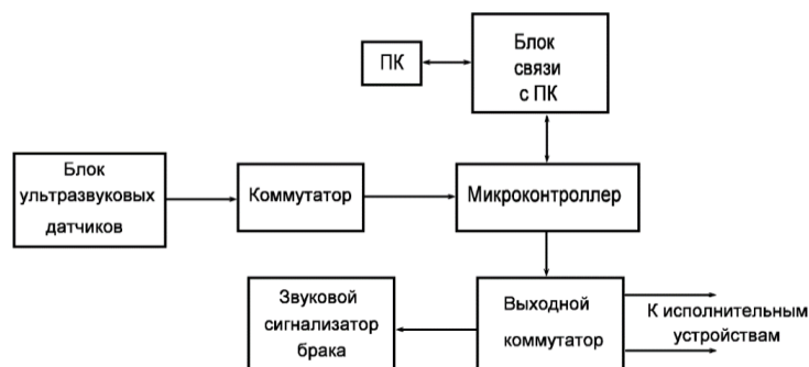
Рис. 1. Структурная схема автоматической сортировки паллет

блока ультразвуковых датчиков через коммутатор в микроконтроллер и затем в ПК. Для уменьшения объема передаваемых данных используется сжатие информации [3].