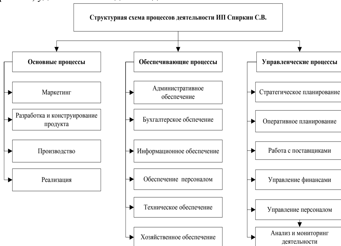
Рис. 2. Классификация бизнес-процессов ИП Спиркин С.В.

в первую очередь с тем, что фабрика по структуре и численности персонала не большая и поэтому не нуждается в приобретении и установке сложного программного обеспечения. Также использование данных методов дает возможность декомпозировать процессы на всех уровнях, используя при этом логические связи и представляя процессы в простом, удобном и наглядном виде.